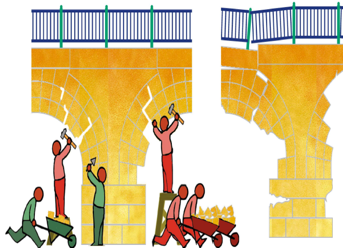
Knochenabbau und -aufbau sind beim gesunden Menschen im Gleichgewicht

Die Lebensdauer der Osteoklasten ist nur kurz, aber sie arbeiten sehr schnell. So benötigen die Osteoblasten mindestens drei Monate, um die Knochenlücken aufzufüllen, die von den Osteoklasten in nur zwei – drei Wochen durch Resorption erzeugt wurden. Dieser Vorteil der knochenabbauenden Osteoklasten erklärt, warum schon geringe Störungen der Knochenneubildung zu einer Verminderung der Knochenmasse und somit zur so genannten Osteopenie führen.